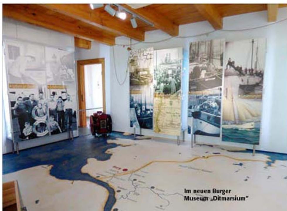
Im neuen Burger Museum „Ditmarsium“

Wegen der Unsicherheiten im Corona-Geschehen müssen wir uns Änderungen im Redaktionsplan ggf. vorbehalten. Wir bitten unsere Leserinnen und Leser um Verständnis.