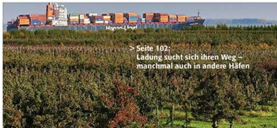
> Seite 102: Ladung sucht sich ihren Weg – manchmal auch in andere Häfen